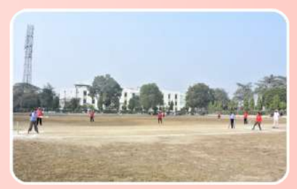
Sports Facility (Cricket)