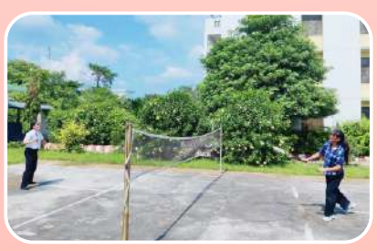
Sports Facility (Badminton)