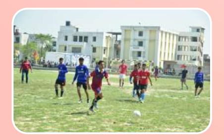
Sports Facility (Football)