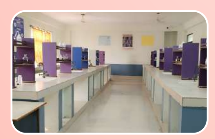
Pharmaceutical Chemistry Lab