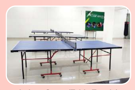
Indoor Game (Table Tennis)